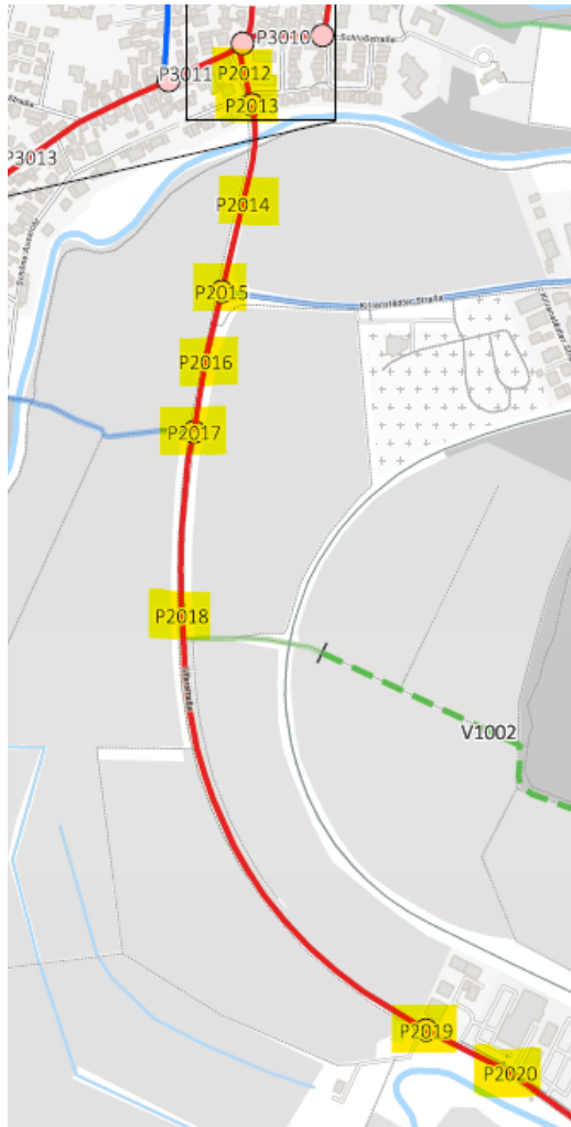
Abbildung 1 Maßnahmen des Pakets Verbindung Büdesheim - Kilianstädten