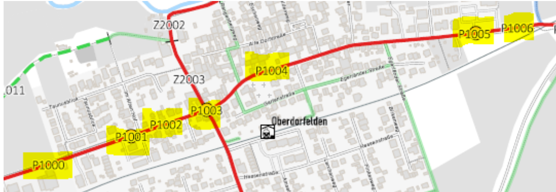
Abbildung 5 Maßnahmen des Sicherheitspakets Oberdorfelden